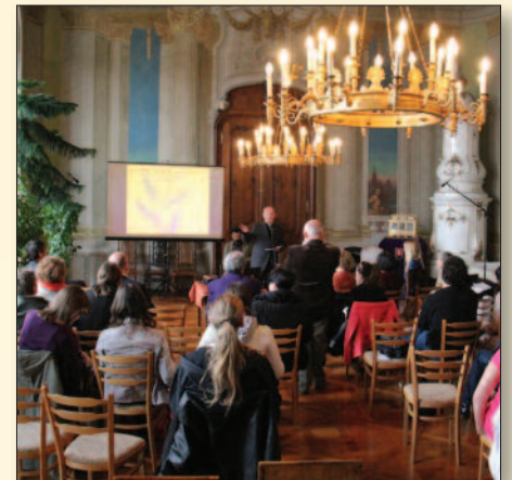
Konferencia az Érseki Palotában