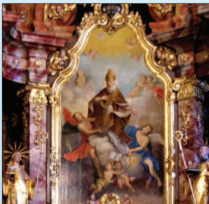
Szent Ányos a tihanyi főoltáron

perjele vezette. Ányos a békétlenkedők reménye, mutatott rá szentbeszédében. Az orleansi püspök élete, áldozatvállalása, imádsága erőt hitet tudott adni a hun seregek támadásában elgyengült gall népek. Ányos üzenete a mához is szól, mondta, hozzánk mai magyarokhoz is, viszálykodó, pártoskodó világunkban. Nem keseredhetünk bele a megpróbáló időbe, s hirdetnünk kell a reményt az átalakulás minden nyűgével-gondjával, tudván: „Isten segít, ha lelkiismeretesen virrasztunk, ha cselekvő bizalommal élünk”.