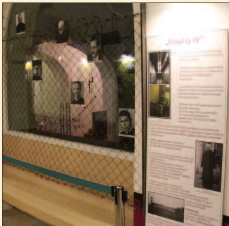
Márton Áron kiállítás