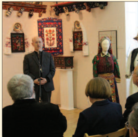
Megnyitó a Laczkó Dezső Múzeumban