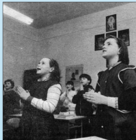
Imádság a pápai iskolában