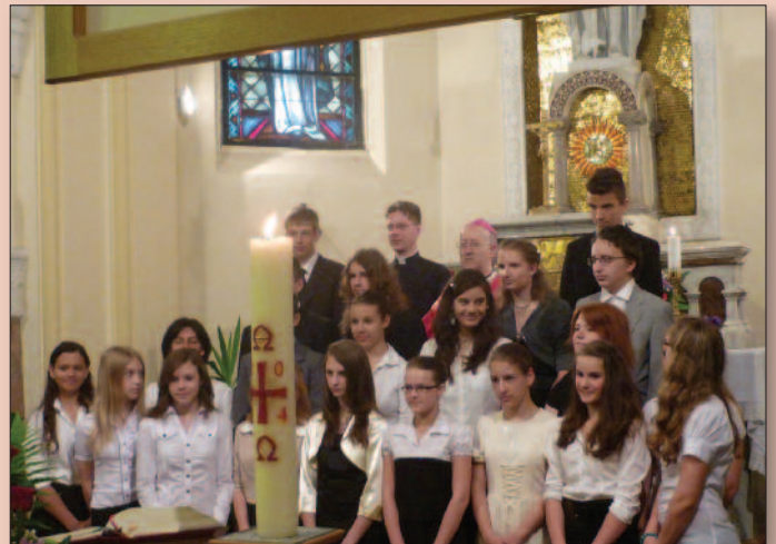
Veszprém - Szent László templom