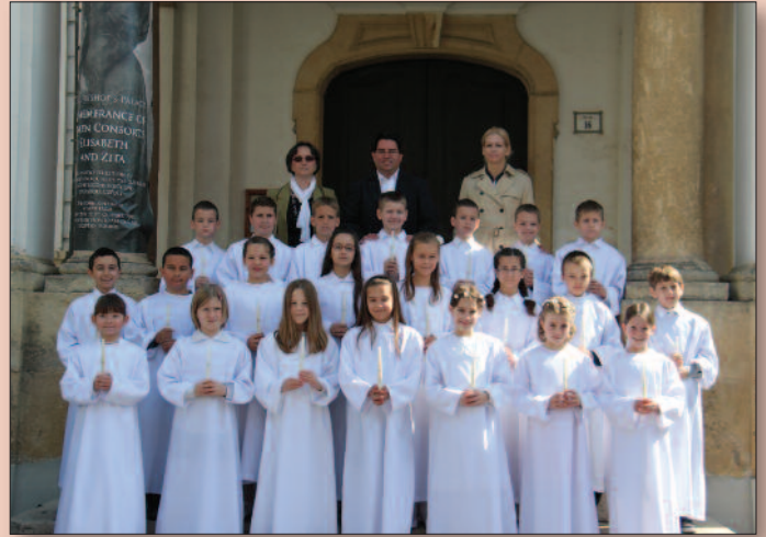
Veszprém - Szent Mihály Bazilika, Padányi iskola 3.a