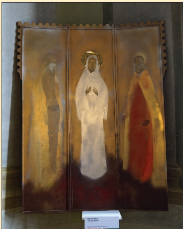
Udvardi Erzsébet Színeváltás című triptichonja