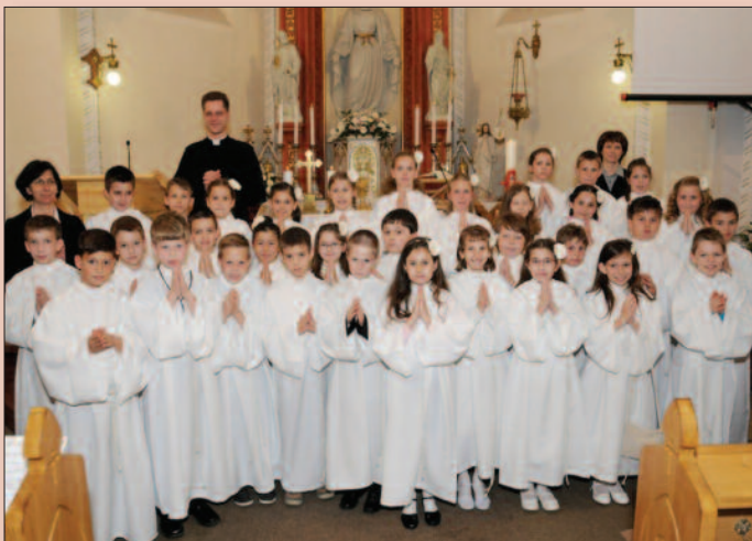
Veszprém - Regina Mundi Plébánia