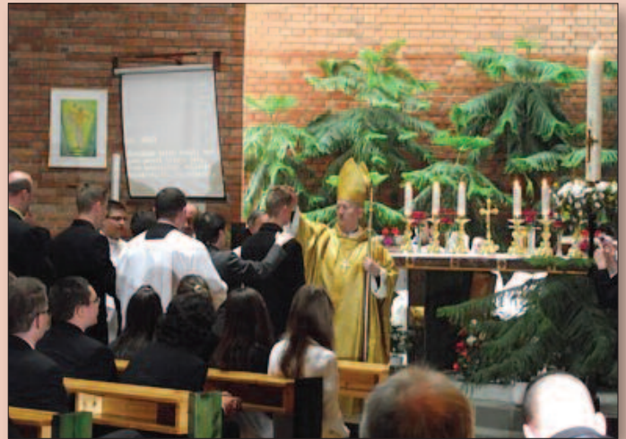
Veszprém - Magyarok Nagyasszonya plébániatemplom