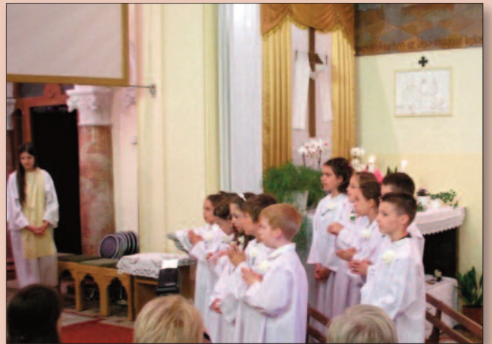
Veszprém - Szent László templom