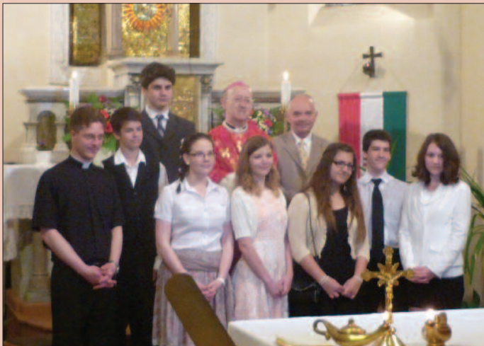
Veszprém - Szent László templom