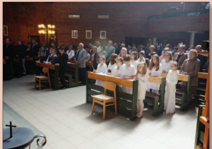
Veszprém - Magyarok Nagyasszonya plébániatemplom