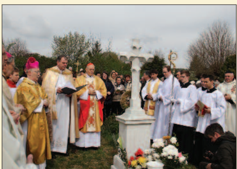
Emlékezés a sírnál