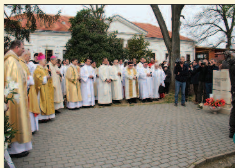
Ima a vértanúság helyszínén