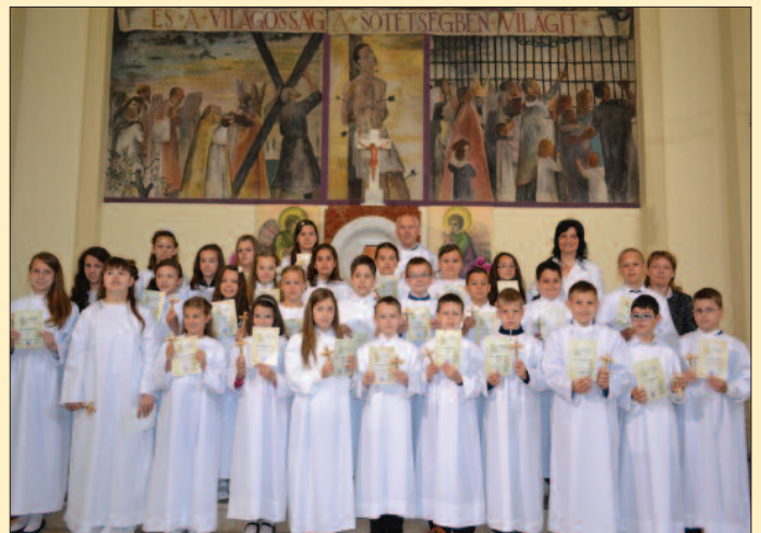
Pápa – Szent Anna