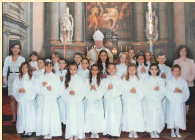
Pápa – Nagytemplom