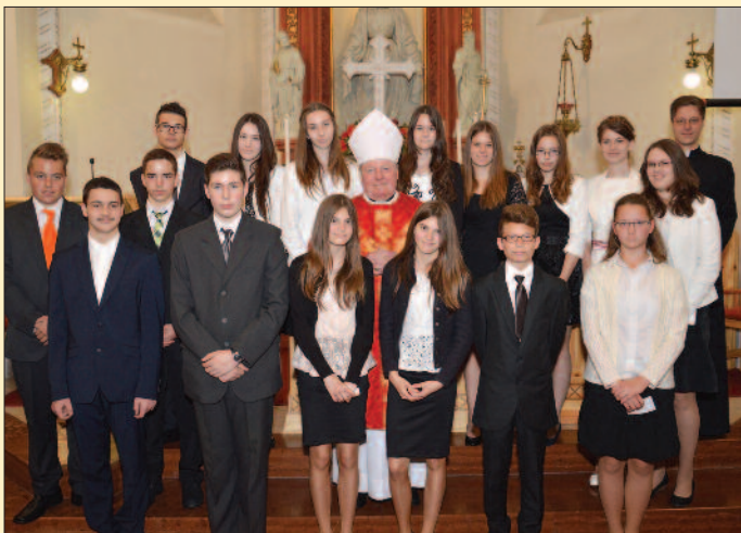
Veszprém – Regina Mundi (Szilágyi iskola)