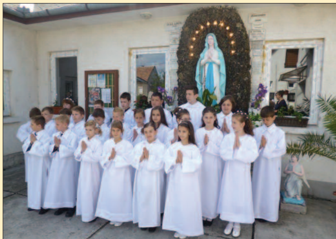
Pápa – Szent Benedek

Május-június az elsőáldozások és a bér mátkozások időszaka. A Veszprémi Főegyházme gyében is számos gyermek vette magához először az Oltáriszentséget, valamint nagyon sok fiatal részesült a bér mátkás szentségében. Köszönjük a lelkipásztoroknak, illetve a hitoktatóknak, hogy megosztották velünk egyházköz ségük ünne pi pillanatait.