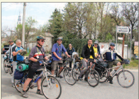
A zarándokok Köveskálon