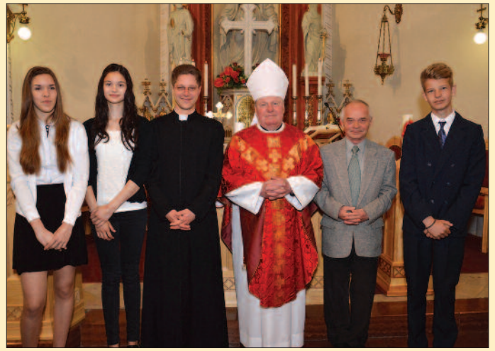
Veszprém – Regina Mundi