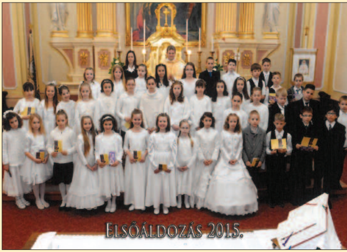
Veszprém – Szent Margit