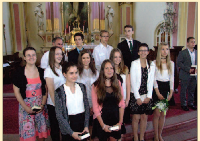
Veszprém – Szent Margit