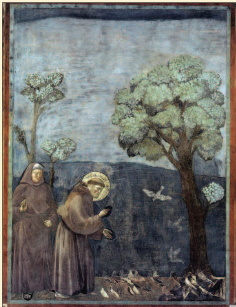
Giotto di Bondone: Szent Ferenc tanítja a madarakat 1297–99. (Assisi, Szent Ferenc-bazilika)

„Dicsérjen s áldjon, én Uram, / kezdednek minden alkotása, / különösen bátyánk-urunk, a Nap, / ki nappalt ád, világít és minket megvidámít. / Fényes ő és ékes ő és sugárzó roppant ragyogása / felséges arcod képemása” – olvashatjuk az 1943-ban Dsi-da Jenő fordításában megjelent vers első versszakát.