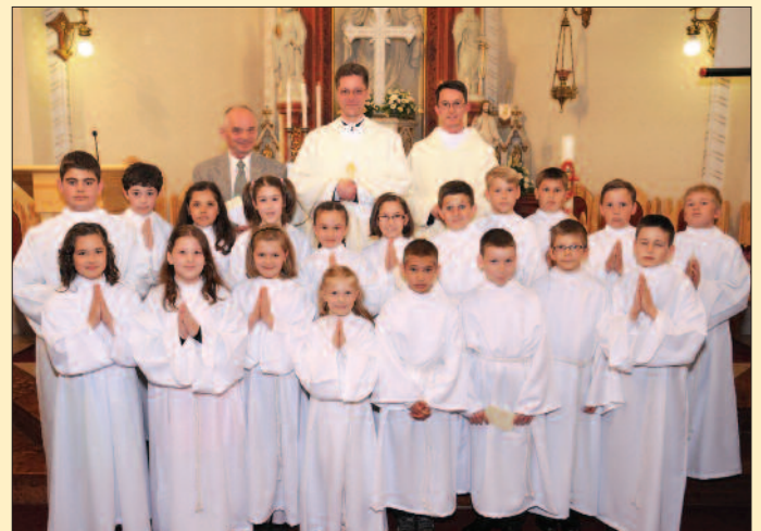
Veszprém – Regina Mundi