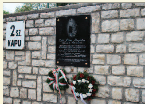
Az emléktábla a fűzfői gyárkapu mellett