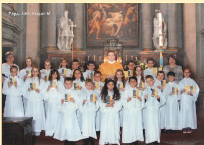
Pápa – Nagytemplom