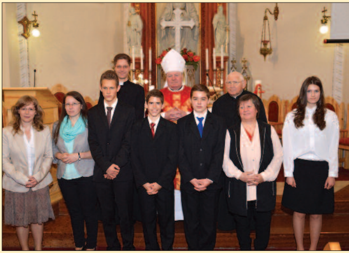
Veszprém – Regina Mundi