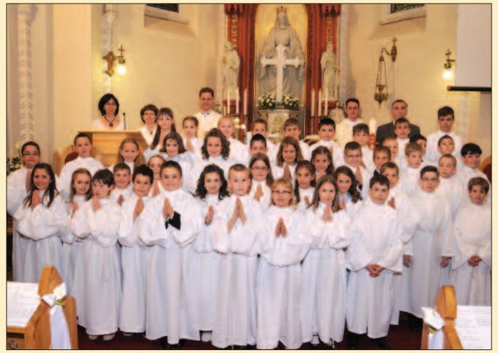
Veszprém – Regina Mundi (Szilágyi iskola)