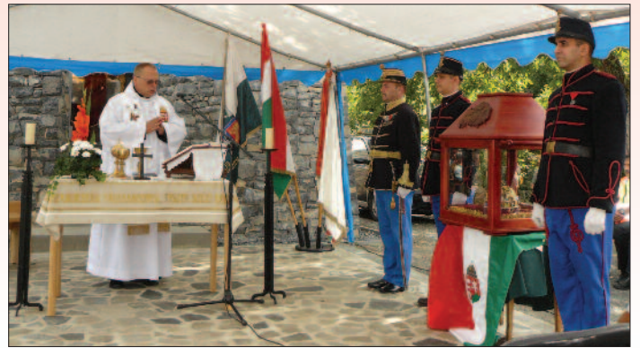
Szent István kápolna, Badacsony-hegy