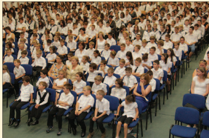
Padányi Katolikus Iskola, Veszprém