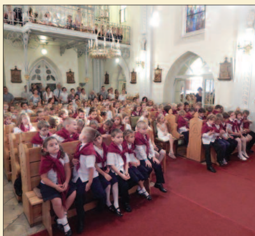
Szilágyi Keresztény Általános Iskola, Veszprém