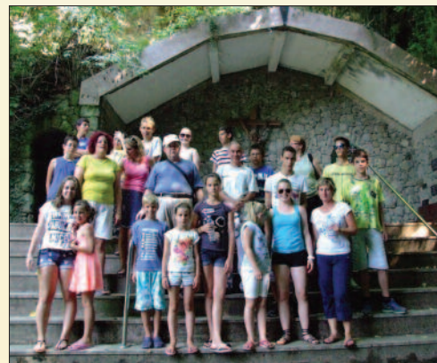
A veszprémi Magyarok Nagyasszonya Plébánia hittanosai Dunafalván és környékén táboroztak augusztus 3-8. között.