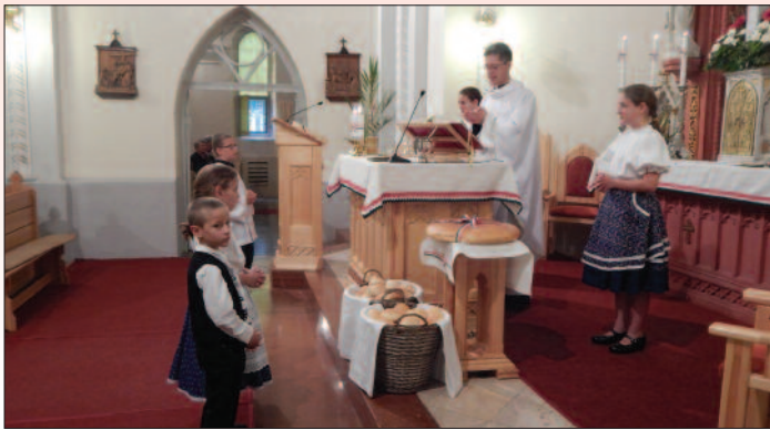
Regina Mundi templom, Veszprém