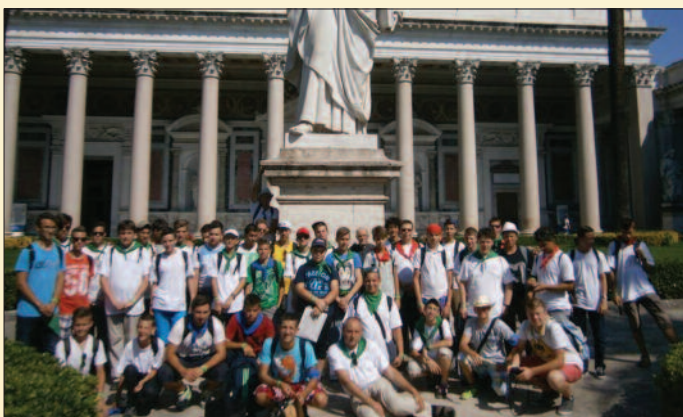
A keszthelyi csapat