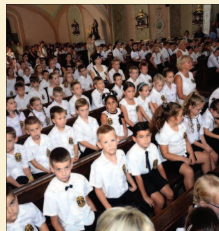
Szent István Király Római Katolikus Általános Iskola, Ajka

Egy régi közmondás is azt tartja: Hasztalan az ember iparkodása, ha nincs rajta az Isten áldása. Tanulásunkkal műveltebbek akarunk lenni, de ugyanakkor jobbakká akarunk válni. Mindket-tőhöz Isten segítségére van szükségünk. Ezért kérjük most: