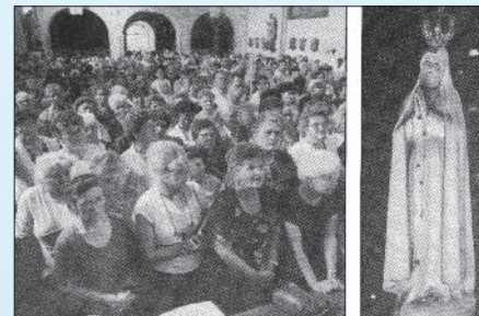
A fatimai kegyesobor Sümegen