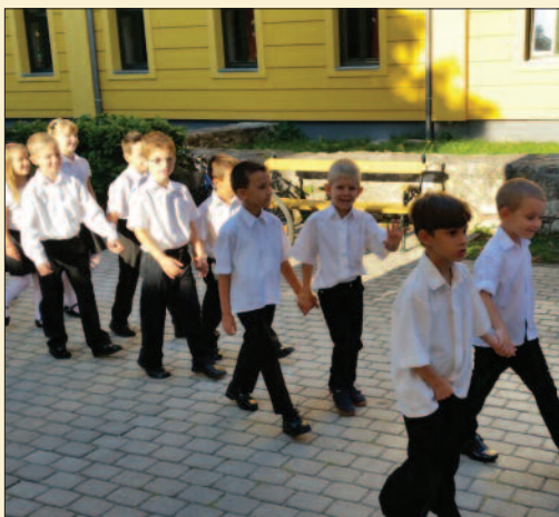
Nagyboldogasszony Római Katolikus Általános Iskola, Tapolca