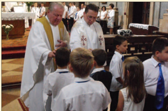
Szent István Római Katolikus Általános Iskola, Pápa

A Veszprémi Érsekség fenntartásában hét általános iskola működik: Ajka, Pápa és Veszprém két iskolája mellett Várpalotán, Tapolcán és Keszthelyen kezdtek meg a tanévet a diákok. Emellett Veszprémben és Pápán is egy-egy óvoda, Veszprémben pedig gimnázium, valamint a Hittudományi Főiskola várja ebben a tanévben is a növendékeket.