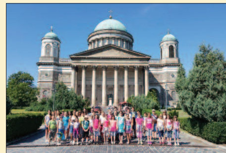
A türjei Premontrei Gyümölcsoltó Boldogasszonyi hittanosai a gógánfai egyházközség hittanosai Esztergomba kirándultak.