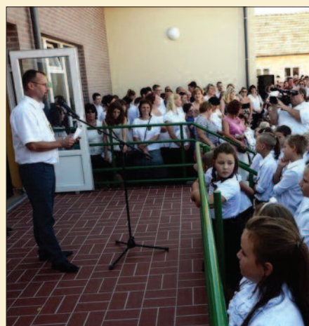
Szent István Király Római Katolikus Általános Iskola, Ajka