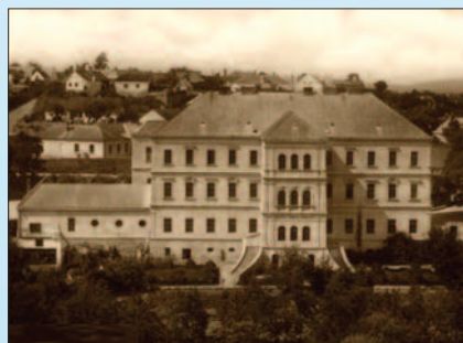
A Davidikum adott helyet az ifjúsági találkozóknak