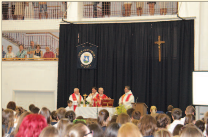
Padányi Katolikus Iskola, Veszprém