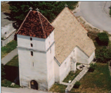
Berhidai Szent Kereszt-templom

1994 tavaszán kisebb fajta csata kezdődött Berhidán a település történelmi, művészettörténelmi ékessége, a központban álló késő román kori, kora gótikus stílusban épült műemléktemplom csendjének, méltóságának, történelmi, lelki miliójének megőrzéséért. A lakosság tiltakozásával találkozott ugyanis az a terv, hogy a templom szoros szomszédságában lévő kertben egy vállalkozónak telket értékesítsen az önkormányzat, ahol az illető élelmiszer üzletet és vendéglátóipari egységet létesítsen. A vitában a műemlékvédelmi hivatal is ellenkezését juttatta kifejezésre, de az önkormányzat a bolt létesítését indokoltnak látta. A kérdést nem sikerült megnyugtató módon lezárni hosszú hónapokon át.