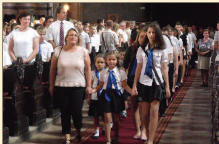
Szent István Római Katolikus Általános Iskola, Pápa