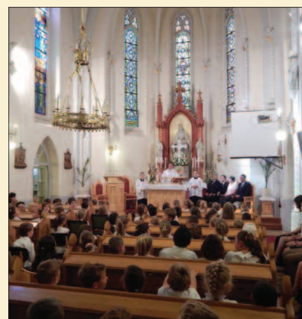
Szilágyi Keresztény Általános Iskola, Veszprém

megmaradjak szeretetemben!” Aztán pedig megyek és teszem a dolgomat. Legyen az tanulás, munka, hivatás. A szeretet által hited erős lesz!