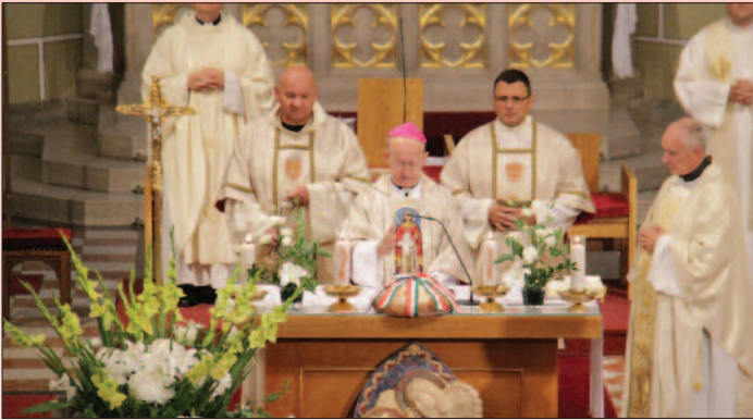
Szent Mihály Bazilika Veszprém