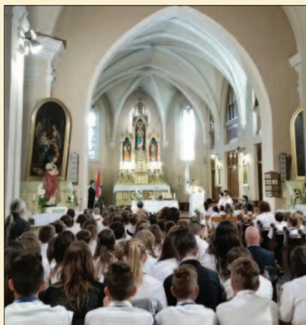
Nagyboldogasszony Római Katolikus Általános Iskola, Tapolca