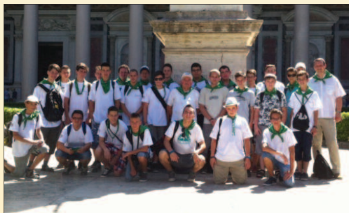
A veszprémi csapat

Kovács Mihály ifjúsági referens atya