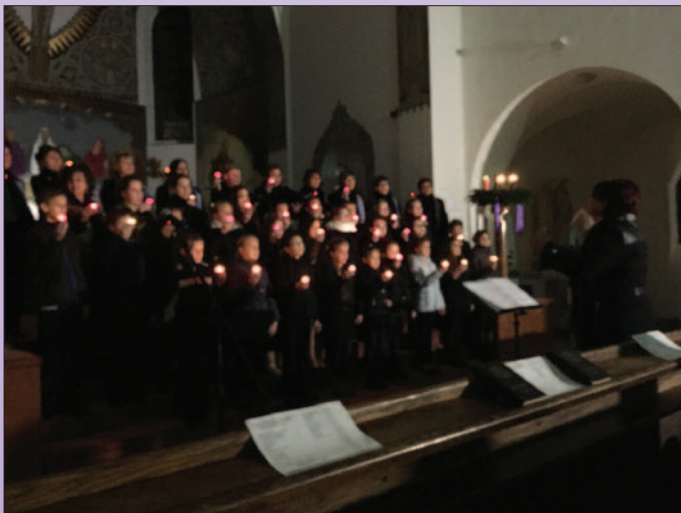
NABE Badacsonytomaj és a Tatai Sándor ált. isk. Kórusa 2015. dec. 12.