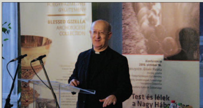
Márfi Gyula érsek

A konferencia nyomon kísérte a tábori lelkészi szolgálatot, az egészségügy és a betegápoló szerzetesrendek, a katonarovoslás tevékenységét a háborúban.