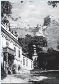
Sümege - püspöki palota