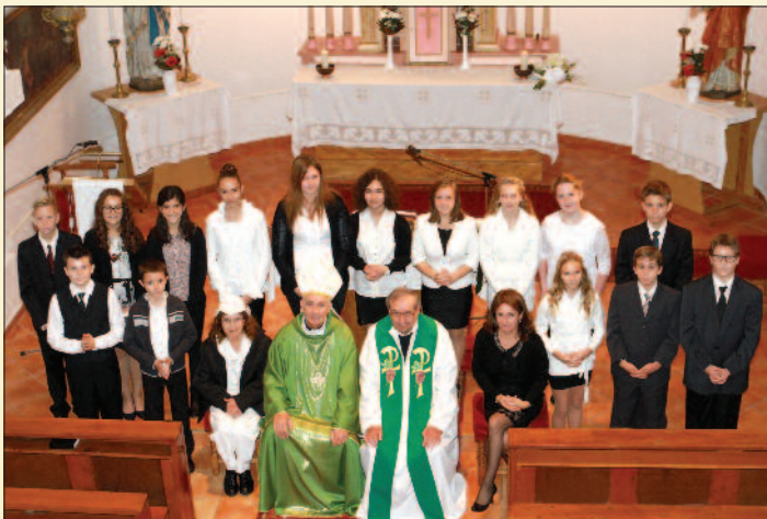
Szigliget, bérálás 2015. október