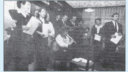
A Veszprémi Kolping-család jótékonysági műsort adott a fogatékkal élőknek

mán látta vendégül a fogatékkal élők hálas közösségét.