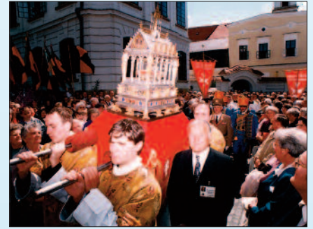
A Szent Jobb fogadása

Június elejére elkészültek a veszprémi egyházmegyei zsinat előkészítő munkadokumentumai. Ezekben többek között megfogalmazódik: „Korfordulón élünk, az európai kultúra és civilizáció átalakulóban van. A mezőgazdaságon és kézművességen alapuló társadalmat még áthatotta a kereszténység. Az új ipari, informatikai társadalom szinte a kereszténységtől érintetlenül jött létre. Ezért a ma és a holnap egyházára