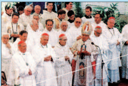
Főpapok, plébánosok az oltárnál a Gizella-misén

Május elején a Gizella-napok ünnepi eseményei között központi helyen szerepelt ezúttal is a már hagyományosnak mondható szabadtéri szentmise a Szentháromság-téren. Ám minden korábbinál fényesebb keretek között zajlott, s bizonyára örökre emlékezetes marad azok szívében, akik részt vettek e szertartáson. A passzai egyházi küldöttség ekkor ugyanis nemes ajándékot adott át ünnepélyesen a Veszprémi Főegyházmegyének – társvédőszentjének, Boldog Gizellának egy karereklyéjét, melyet díszes ereklyetartó szekrényben az oltáron helyeztek el a jeles alkalommal. A szentmise fényét tovább emelte, hogy a szertartásra ugyancsak Veszprémbe érkezett a Szent István-ereklye, a Szent Jobb is Budapestről,