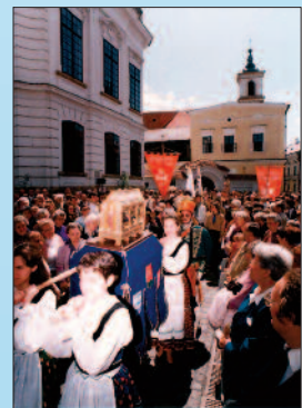
A Boldog Gizella-ereklye fogadása