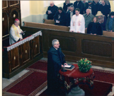
Református nagytemplom, Veszprém