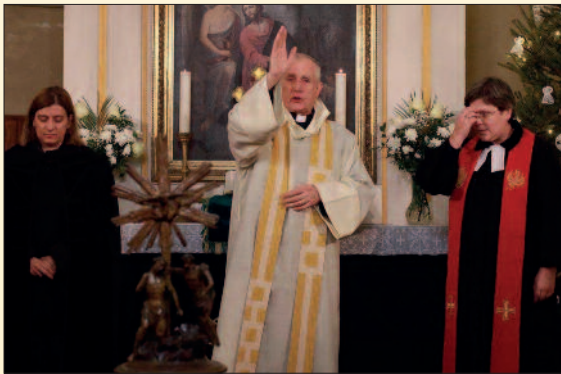
Evangélikus templom, Veszprém

Idén január 15. és 22. között rendezték meg a Krisztus-hívők egységéért hirdetett ökumenikus imahetet. A több mint 100 éves hagyománnyal rendelkező rendezvénysorozat a világ minden táján megrendezik. Az idei ökumenikus imahét bibliai mottója: „... Krisztus szeretete szorongat minket...” 2Kor 5,14-20. A nyolcnapos programsorozat a magyarországi történelmi egyházak egyik legnagyobb közös rendezvénye. A Veszprémi Főegyházmegye több településén, így Veszprémben, Pápán, Tihanyban és Bakonycsernyén is együtt imádkoztak a különböző felekezetek tagjai.