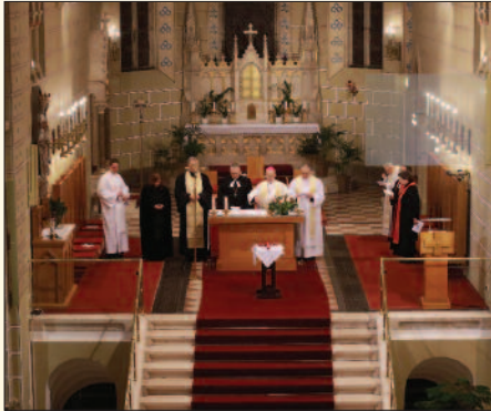
Szent Mihály Bazilika

Száz évvel ezelőtt, Skóciában vált hagyománnyá, hogy januárban egymás templomában imádkoznak a felekezetek. Az ökumenikus nemzetközi imahét a keresztény egyházak világszerte közös imahete, amelyet évről évre januárban rendeznek meg. Először Paul Wattson, anglikán pap 1908 januárjában hívta imanyolcadra a keresztény hitű embereket, felekezeti hovatartozástól függetlenül. Hatvan évvel később az Egyházak Ökumenikus Tanácsa és a Keresztény Egységértörkvens Pápai Tanácsa közösen adott ki imaszövegeket erre az oktávra (nyolc napra), ezzel is támogatandó az ökumenikus törekvéseket.