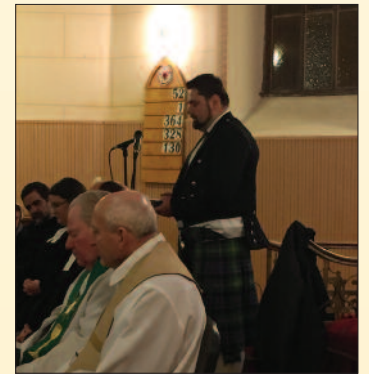
Evangélikus templom, Pápa