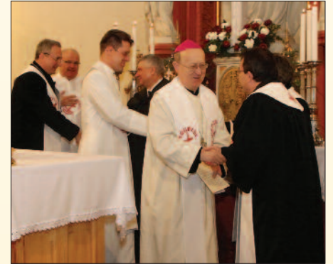
Regina Mundi templom

Idén január 15. és 22. között rendezték meg a Krisztus-hívők egységéért hirdetett ökumenikus imahetet. A több mint 100 éves hagyománnyal rendelkező rendezvénysorozat a világ minden táján megrendezik. Az idei ökumenikus imahét bibliai mottója: „... Krisztus szeretete szorongat minket...” 2Kor 5,14-20. A nyolcnapos programsorozat a magyarországi történelmi egyházak egyik legnagyobb közös rendezvénye. A Veszprémi Főegyházmegye több településén, így Veszprémben, Pápán, Tihanyban és Bakonycsernyén is együtt imádkoztak a különböző felekezetek tagjai.