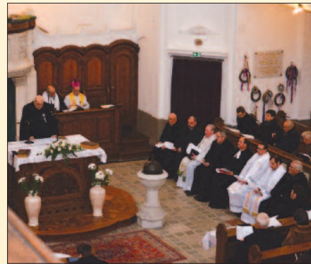
Református templom, Pápa