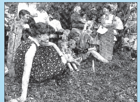
Katolikus családok napja a Davidikumban