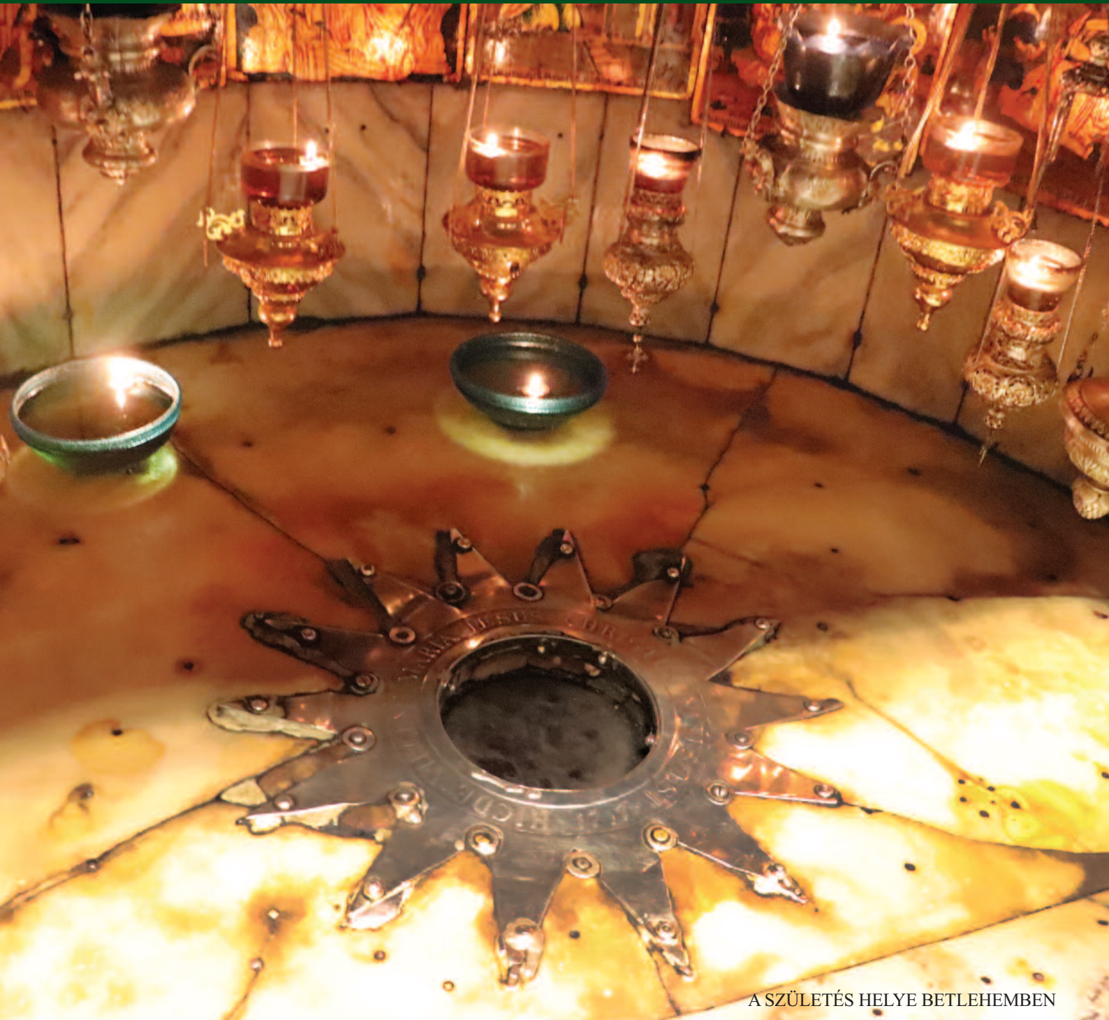
A SZÜLETÉS HELYE BETLEHEMBEN