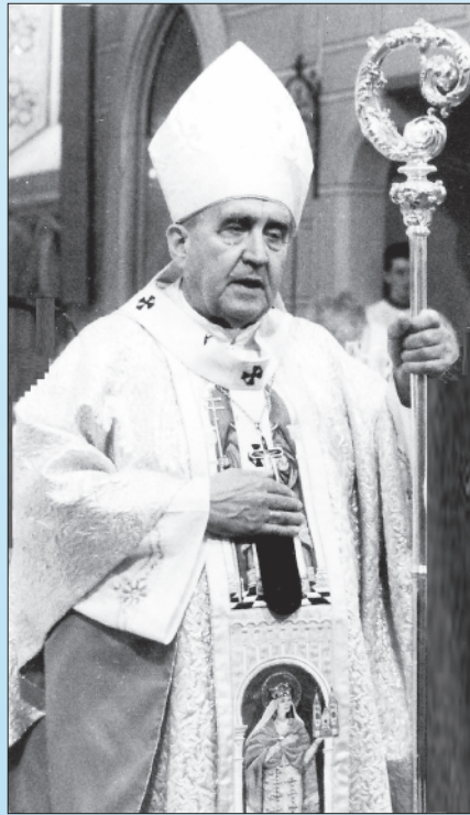
Szendi József érsek a családokért celebrált szentmisét

A következő munkanapon a „megszentelés” témaköre került a beszélgetések, viták középpontjába. Szó volt a keresztesítés, bérmálás, a bűnbocsánat, az egyházi rend és a házasság szentségéről, az Oltáriszentségről, a betegek szentségi kenetéről. A jelen-