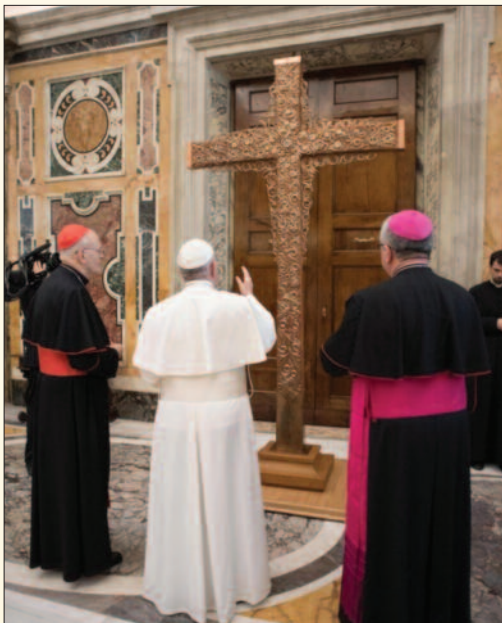
A szentatya megáldotta a 2020-ban Budapesten megrendezendő 52. Nemzetközi Eucharisztikus Kongresszus (NEK) missziós keresztjét.