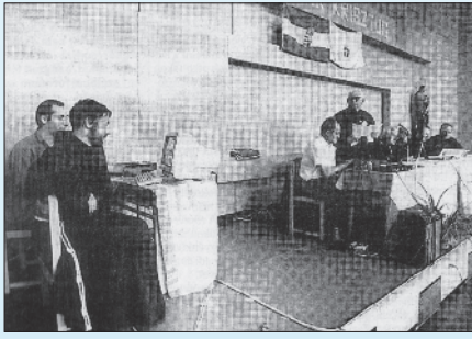
Egyházmegyei zsinat a Hittudományi Főiskolán

1996. június 18-20. között rendezték meg Veszprémben – mintegy fél éves előkészület után – az egyházmegyei zsinatot a Hittudományi Főiskolán, amely kiemelkedő jelentőségű esemény volt az egyházmegye életében. Hasonló tanácskozást legutóbb több mint hat évtizede, 1934-ben tartottak az egyházmegyében. II. János Pál pápa 1991-es magyarországi látogatásakor kifejezetten kérte a magyar püspöki kart, hogy tartsanak zsinatokat Isten egész Népeinek – a II. Vatikáni zsinat egyházképének szellemében: papoknak, szerzeteseknek és világi híveknek – aktív részvételével az egyház megújulása érdekében. 1994-től szerveződtek meg a zsinatok folyamatosan a magyar egyházmegyéikben, Veszprém a sorban negyediként tartotta meg tanácskozását. A három naposra tervezett fórumon 50 papi és 40 világi képviselő volt jelen, mint témafelelősök és megbízott résztvevők. A zsinat alaptörékvését jellemezte az egyházi munkatársak – papok és világiak – türelmességre intése, ami a pasztorizációban különösen követendő feladat, hiszen nem egy virágzó korszakban dolgozik az egyház, hanem több évtizedes keserves pusztítás utáni lábadozás állapotában van.