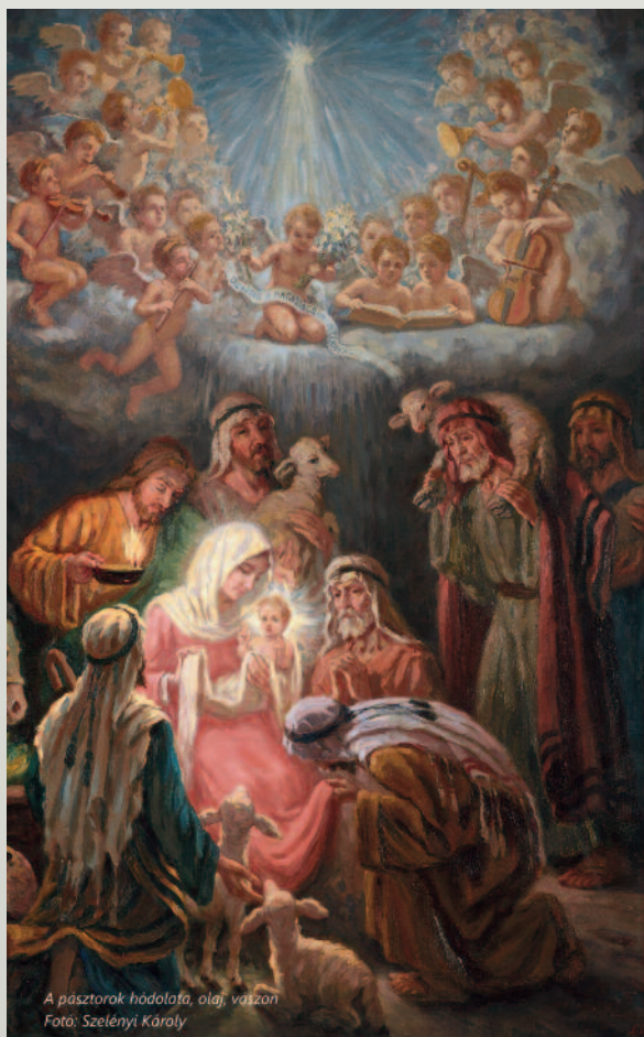
A pásztorok hódolata, olaj, vászon

Aranyt a legtöbben csak költőként ismerik, ám változatos tisztégeit felsorolni is hosszú volna, emlékeztetett. Életének 65 esztendejéből 53-at szorgalmas, kötelességtudó, és kiemelkedően precíz, pontos és áldozatkész munkával töltött. Volt tanár, jegyző, újságíró, szerkesztő, műfordító, akadémiai titkár, főtítkárr többek között, sőt, amit csak kevesen tudnak, zeneszerző is. Saját és kortársai verseihez, s a nép ajkán született verses szövegekhez komponált dallamokat. Ez utóbbiak egyike egy eredetileg az erdélyi nép körében született imádságos vers, az Erdő mellett estvéledtem kezdetű, amely később népdallá vált, s Kodály Zoltán már Pásztón jegyezte le népdalgyűjtő körútján, majd énekkari átíratát is elkészítette Esti dal címmel. Mindezek alapján megállapítható a Nomen est omen jegyében Aranyról: valóban arany-tartaléka ő a magyar kultúrának, szinte kimeríthetetlen lelki-szellemi öröksége. Mikszáth Kálmán találóan írta Arany ravatalánál: „Ott fekszik hidegen, mozdulatlanul, ami törekény volt benne – ami arany volt, az megmaradt...”