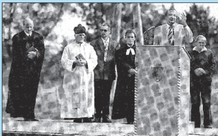
Településvezetők és lelkészek együtt imádkoztak Balatonfüzfőn