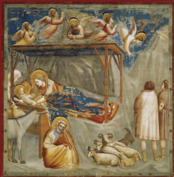
Giotto di Bondone. Jézus születése, részlet, 1305–1306. Scrovegni-kápolna, Padova

osztrák katonákkal, saját zaklatott lelkiismeretükkel s az út nehézségeivel a Kárpátok ember- és lélekpróbáló útjain. Ugyancsak a magyar forradalom hírére határoznak hazájukba való visszatérésről az osztrák katonai és szentpétervári diplomáciai kötelékben szolgáló Baradlay-fiúk a Jókai Mór nagy sikerű regénye nyomán forgatott filmben, A kőszívű ember fiaiban. Valójában mindkét film tragikus kicsengésű, a csoportos és az egyéni tragédia filmes hőskölteménye. „A történelmi lecke szép és tagolt fölmondása helyett – írta A történelem metaforája című, a 80 huszár kísérő tanulmányában Csoóri Sándor – azt a torokszorító érzést akartuk az emlékezet aljáról fölszabadítani, amely nemcsak ebben az egyetlen történetben ráz meg és kísért bennünket, de szinte végigköveti történelmünk minden nagy kezdeményezését: fölkészülés nélkül, vérbe boruló aggyal ugrani bele a cselekvés örvénylő mélyvízébe.” (Mintha csak Arany János A nagyidai cigányok című szatirikus költeményének kritikás hangjai csendülnének vissza e sorokban.) A kőszívű ember fiai című filmdrámában az egyéni tragédia állítja meg a nézőt (Baradlay Jenő háborúról, forradalmakról alkotott, végeredményben nagyon is jézusi véleménye/vallomása az, ami bearanyozza végül az epilógusban áldozat-átvállaló halálát.) A filmben szerepekben többek között Béres Ilona, Sulyok