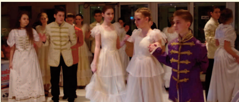
III. Keresztény bál a tapolcai katolikus iskolában