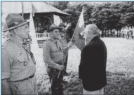
Díszzászlót kapott a cserkészcsapat