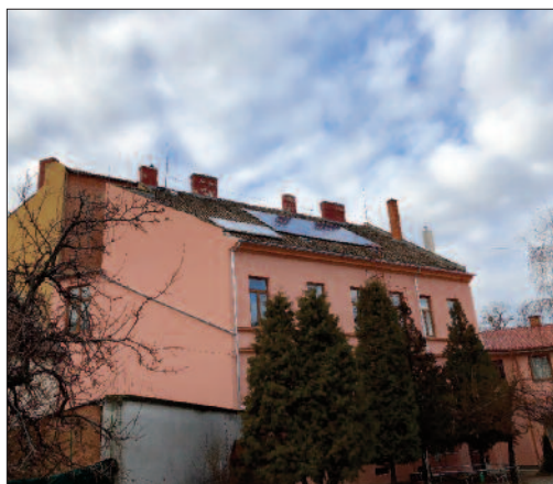
Pápa, Szent Anna Óvoda