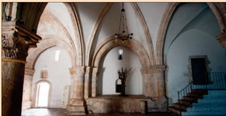
Az utolsó vacsora terme Jeruzsálemben