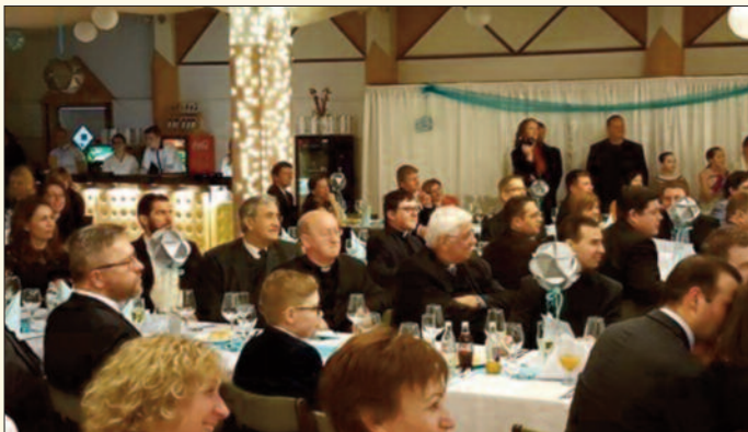
Ranolder bál Keszthelyen

A nagyesztergári és jádsi egyházi kórus közösen énekelt, majd a két község hittanosainak éneklése következett.