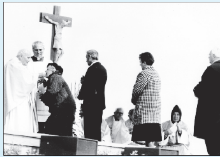
A győri szertartáson a Szentatya is áldoztatott

Az év számos rangos eseménye közül kiemelkedik II. János Pál pápa – immár második – magyarországi látogatása, melyre szeptember elején került sor Pannonhalmán és Győrött. Az ezeréves magyar iskola jubileumát ünneplő bencés főapátságban zárt körben találkozott az egyházfő a szerzetes-