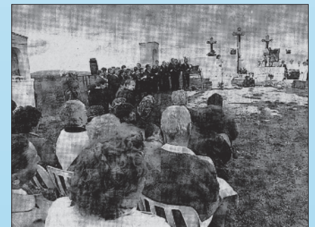
A helyreállított kálvária felszentelése Gyulafirátóton