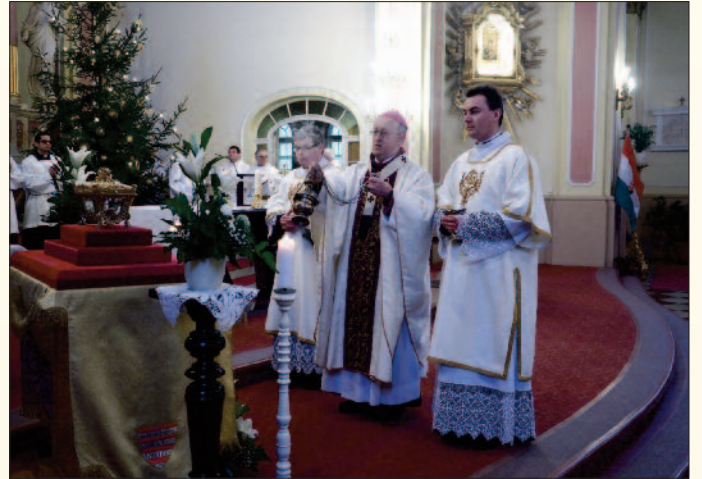
A szentmisére Szent Margit ereklyéjét ünnepélyesen kihelyezték tiszteletadásra.

Szentbeszédében a főpásztor Szent Margit életéről beszélt, akit négy évesen a Szent Katalin kolostorba adták, tizenkét évesen egyszerű, tizenkilenc évesen pedig örök fogadalmat tett. Hűséges maradt Istenhez, ugyanis nem ment férjhez. Az elmúlt évszázadok alatt az Árpád-ház adta hazánknak a legtöbb szentet, a róluk készült ábrázolások hazánkban és külföldön egyaránt megtalálhatóak. Szentséges életével Szent Margit példát mutat a mai magyar családok számára, hangsúlyozta a főpásztor.