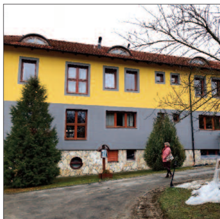
Hévíz, Szent Lukács Otthon

A projektről bővebb információt az alábbi oldalon olvashatnak: http://veszpremiersekseg.hu