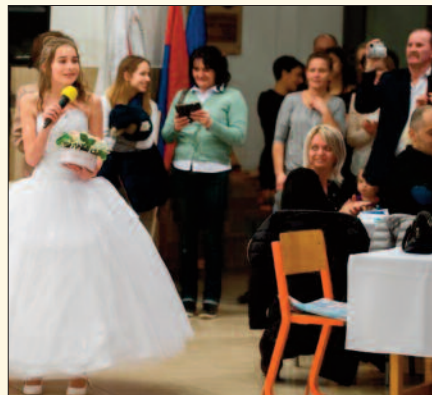
Szülői munkaközösségi bál a pápai katolikus iskolában