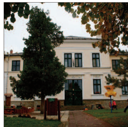
Veszprém, Szent Margit Óvoda