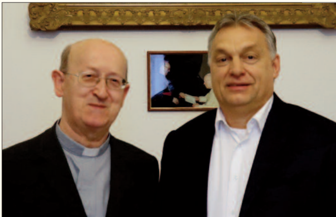
Orbán Viktor, Magyarország miniszterelnöke február 8-i veszprémi látogatásán tiszteletét tette Márfi Gyula érsek úrnál is.