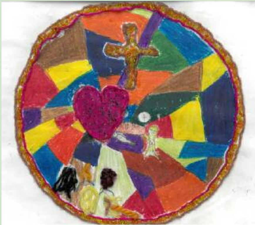
Seres Júlia alkotása