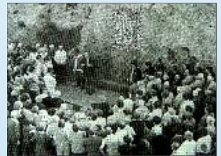
Kegeleti hely átadása a viadukton

Szép és hálás színfoltja volt Veszprémnek ugyancsak ez év tavaszán, mikor a Padányi Biró Márton Katolikus Általános Iskolába járó diákok és szüleik szentmise keretében tettek bizonyosságot az iskola keresztény szellemiségéről a város katolikus templomaiban. Egy édesapa a II. Vatikáni Zsinat szavait idézte: „A katolikus iskola azon