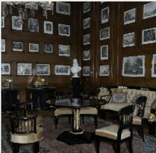
Az érseki palota megújított enteriőrkiállítása. Az I. Ferenc József fogadására készült felújított empire ülögarnitúra.

ICOM magyarországi szervezetének elnöke nyitotta meg. Azt gondolhatná a látogató, hogy egy egyházi épületben liturgikus tárgyak kiállítását látja majd, s bár itt is jelen vannak ezen műtárgyak, ám ez a kiállítás mégis elmozdul a profanitás felé, mutatott rá. Mintegy 100–150 éves történeti periódus enteriőrjeit látjuk a palota termeiben, amelyek máig élő helyi és nemzeti hagyományokba engednek bepillantást. Veszprémben a hagyományörzés különösen hangsúlyos, mutatott rá, hiszen a történelem része, hogy a veszprémi püspökök koronázták a magyar királynékat évszázadokon át. III. Béla amikor fölállította az első kancelláriát Magyarországon, kijelölte a királynéi kancellária vezetőjének a mindenkori veszprémi püspököt. Ettől kezdve a főpásztorok királynéi udvarhoz fűződő kapcsolata igen szoros, igen mély volt évszázadokon keresztül, s ez egészen Mohácsig tartott, majd a török kori fölszabadulás után újraéledt. Mindez ebben a nemesen, választékosan, kifinomultan berendezett és felújított, restaurált érseki palotában jelen van, erősen érződik a hely egyházi és hitbéli miliójében, bizonyítva: keresztény értékeink egyben tartanak bennünket. Sőt e keresztény értékek annyira jelentősek, hogy elérnek egészen Kínáig, elnyúlnak az arab világig, amint a palota kiállításán ez látható. Olyan hajszálgyökök ezek, amelyek az egész kontinens egyben tartják, és amelyek megalapozzák a mindennapi gondolkodásunkat – mutatott rá a Magyar Nemzeti Múzeum főigazgatója. De