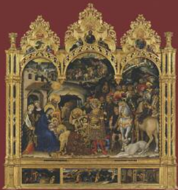
Címkép az Főoltáron. Díszítés: Háromkirályok imádkozása, 1472. Santa Trinita, Firenze

A Gyűjtemény kiadványai megrendelhetők és megvásárolhatók: 8200 Veszprém, Vár u. 35., +36 88 426 095, info.boldoggizella@gmail.com