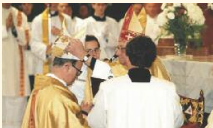
Püspökké szentelése Egerben

Jelmondata: „A szeretet soha el nem múlik” 1Kor 13,8