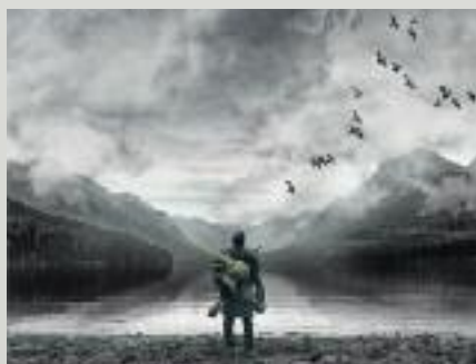
Jelenet a Szürke senkik című magyar háborús filmdrámából.

a neve is jelzi társadalmi státuszát: Alattvaló János) és családja civil életébe tekinthetett be a néző, s élhette át azt a drámát, amely akkoriban millió családot tönkretett: amikor a családfő megkapta a háborús katonai behívóparancsot. A hátrahagyottak hamarosan végzetes hírt kaptak