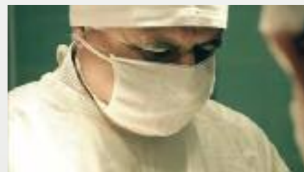
Jelenet a Linner doktor, egy nem mindennapi orvos története című magyar dokumentumfilmből.

ket. Stílusában/műfajában kilógott a többi film sorából, nemegyszer a szatíra határait súroló éllel leplezte le a háború utáni elkorcsosult világot. Bemutatta, miként húztak sokan hasznót a harc- térén elesettek halálából, a temetések- ből, emlékművek állításá- ból, és ezáltal hogyan