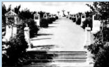
A IV. Károly Kálvária - egykori képeslapon