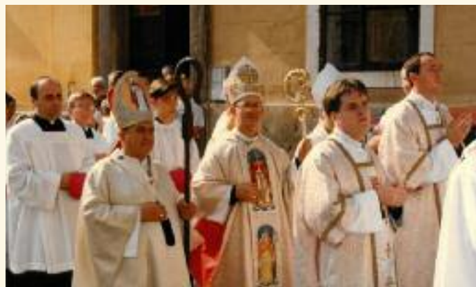
Veszprémi érseki beiktatás

Küldött: A Veszprémi Főegyházmegye lapja. Kiadja a Szaléziánium Érsekségi Turisztikai Központ, 8200 Veszprém, Vár u. 31. Tel.: 88/580-528, e-mail: kuldott@veszpremiersekseg.hu . A szerkesztőbizottság tagjai: dr. Márfi Gyula érsek, dr. Mail József, Megyesi Ferenc, Pálfalviné Ősze Judit. Munkatársak: Földi Gábor, Köviné Bósz Martina, Nagy Zoltán. Fotó: Nagy Lajos, Szaléziánium, Magyar Kurir, egyházközségek. Kéziratokat és fotókat nem őrünk meg és nem küldünk vissza. A kéziratok rövidítési jogát fenntartjuk. Az újságban található cikkek a forrás megjelölésével szabadon felhasználhatók.