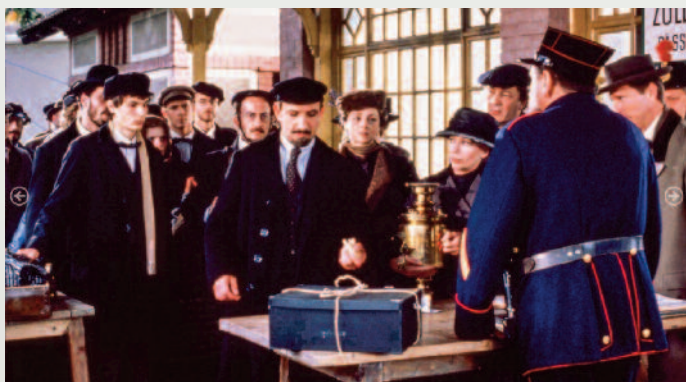
Jelenet a Damiano Damiani által rendezett A Lenin-vonat /Il Treno di Lenin, 1988/ című francia–nyugat-német–olasz–osztrák történelmi filmből. Lenin szerepében Sir Ben Kingsley.

Bűnösök és áldozataik – Ideológiák és diktatúrák a 20. század első felében címmel rendezte 2019. október 16-tól december 11-ig a Múzeumok Őszi Fesztiválja programsorozat keretében az Őszi Filmhetek tematikus történelmi témájú filmszemplét a Boldog Gizella Főegyházmegyei Gyűjtemény. A több éve, minden évben egy vagy két nagyobb téma köré csoportosított vetítéssorozat 2019. évi tavaszi programja az első világháborút lezáró 1919–1920. évi Párizs környéki békeszerződések – közöttük az 1920. évi trianoni békediktátum – aláírásának pillanataiba engedett bepillantást. A 2019. évi Őszi Filmhetek bemutatott történelmi, háborús filmjei ideológiák és diktatúrák megszületéséhez kapcsolódtak a 20. század első felében: a leninizmus, sztálinizmus, a kommunista és náci diktatúra kibontakozásához. A Gyűjtemény az 1915 és 1917 közötti örmény népirtás történetéről az Oszmán Birodalomban, a mintegy másfél millió örmény erőszakos kitelepítéséről és lemészárlásáról, az ortodox egyház szentjei sorába emelt II. Miklós cár és családja kivégzéséről, valamint a „szeretet vértanúja”, Szent Maximilián Kolbe minorita szerzetes önfeláldozásáról is bemutatott filmművészeti alkotásokat. Egy vetítés az 1926–1929 közötti mexikói keresztényüldözés, a Cristero-háború történetét is felelevenítette.