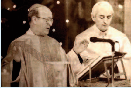
Rekvium a Don-kanyari áldozatokért

1997 decemberében piarista öregdiákok kezdeményezésére és rendezésében ünnepi kiállítással és ünnepi kiadvánnyal emlékeztek meg a veszprémi piarista templomban a rendalapító Kalazanci Szent József kezdeményezésére 400 esztendeje, 1597 végén Rómában megnyitott első ingyenes népiskola történetéről, a kegyes tanító rend későbbi jeles iskoláiról, a veszprémi piarista nevelőkről, s mindazon neves személyiségekről, akik piarista iskolák falai között tanultak, a piaristák útját egyengették. A kiállítási tablókon megidéztek emléket Dugonics András írónak, Révai Miklós nyelvésznek, Öveges József fizikusnak, Schütz Antal egyetemi professzornak, Sík Sándor költőnek, későbbi tartományfőnöknek, Kopácsy József, Lékai László, Prohászka Ottokár, Völkra Ottó püspököknek többek között. Egy ünnepi kötetet is bemutatnak, amely a jeles évfordulóra jelent meg Emlékkönyv címmel dr. Varga Miklós piarista confrater szerkesztésében.