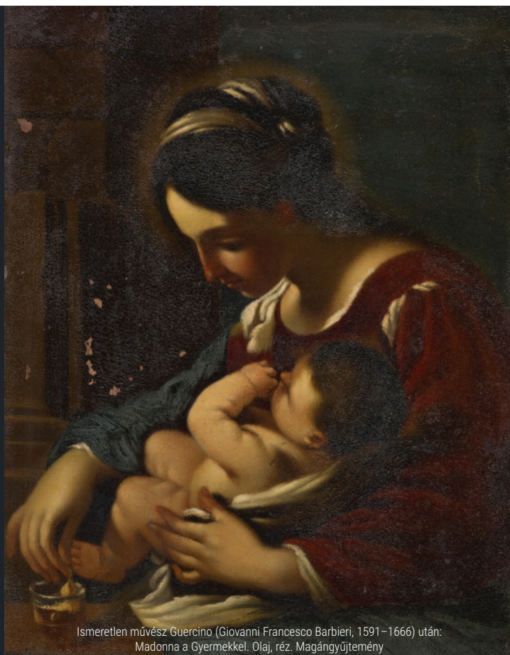
Ismeretlen művész Guercino (Giovanni Francesco Barbieri, 1591–1666) után: Madonna a Gyermekkel. Olaj, réz. Magángyűjtemény

Áldott karácsonyt kívánnak a Boldog Gizella Főegyházmegyei Gyűjtemény munkatársai 2019 karácsonyán