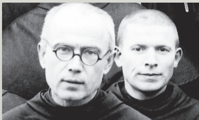
Szent Maximilian Kolbe (1894–1941) minorita ferences szerzetes, a „szeretet vértanúja”