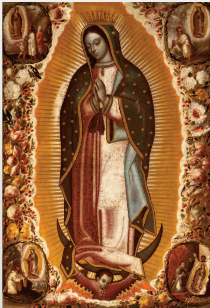
A Guadalupei Miasszonyunk a mexikói guadalupei bazilikában őrzött 16. századi Mária-ikon. 1910-től a Guadalupei Szent Szűz egész Latin-Amerika égi patrónája, 1935-től a Fülöp-szigetek védőszentje

A katolikus papok letartóztatása és száműzése után a Vallásszabadság Védelmének Országos Ligája vezette a felkelést, tagjai elsősorban fiatal középosztálybeliek voltak. (Tagjai 1926 őszére már 800 000 főt számláltak, közöttük 500 000 tag nő volt. A nők gon-