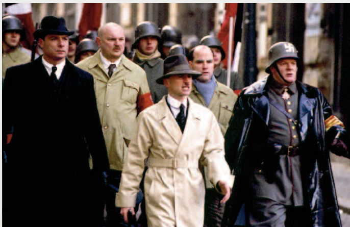
Jelenet a Sztálin /Stalin, 1992/ című amerikai–magyar életrajzi drámából. Sztálin szerepében Robert Duvall Oscar-díjas amerikai színész. Zinovjev szerepében Bálint András, főbb szerepekben Julia Ormond, Joan Plowright, Maximilian Schell. A filmet Ivan Passer rendezte, operatőr Zsigmond Vilmos.