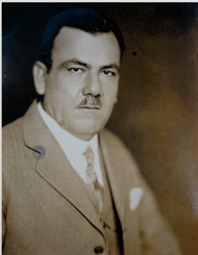
José Luis Sánchez del Río (1913–1926) világi vértanú alig tizennégy évesen halt vértanúhalált a Cristero-háborúban

Az 1917. évi alkotmány ellenére a mexikói nép valósággyakorló, hívő és a katolikus hit iránt elkötelezett maradt. Plutarco Elías Calles 1926-tól életbe léptette az úgynevezett Calles-törvényt, amelynek értelmében betiltották a nyilvános egyházi szertartásokat, bezárták az összes egyházi, szerzetesi kézben lévő iskolát, a papság létszámát korlátozták, papokat száműztek, megtörtént az egyházi vagyon elkobzása. A mexikói katolikus püspöki kar 1926. július 31-én, a Calles-törvény érvénybe lépésének napján azonnal felfüggesztette a vallási szertartásokat, az első kivégzések után a püspökök a plébánosokat is visszarendelték a plébániáikról. Mivel a mexikói katolikus egyház az 1920-as években megosztott volt, a törvény megítélésében a püspöki kar sem képviselt egységes álláspontot: voltak, akik békét kerestek a kormánnyal, voltak, akik szembenállást tanúsítottak,