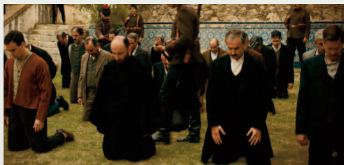
Jelenet Az ígéret /The Promise, 2016/ című spanyol–amerikai történelmi filmből. Rendező: Terry George. Főszerepekben Charlotte Le Bon, Christian Bale és Oscar Isaac.